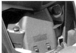
Hier paßt kaum was hinein

Der reisetaugliche Geopolis ist eine Alternative zu den Luxus Schiffen