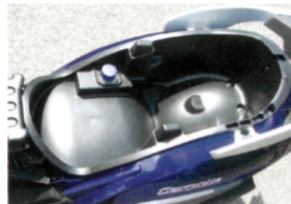
Helmfach lang, aber zu flach