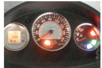
Chromzieringe im Cockpit