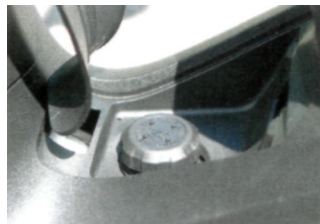
Großer Tank, dicker Schlund